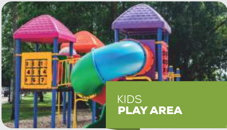
KIDS PLAY AREA