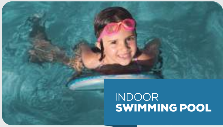
INDOOR SWIMMING POOL